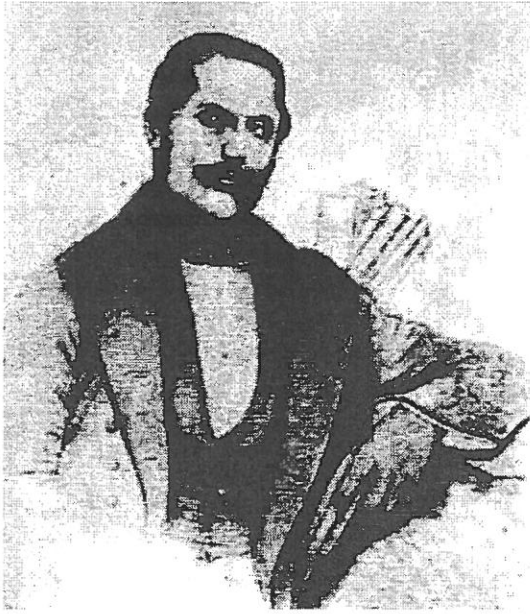
G. Barițiu după un portret stilizat din 1863.