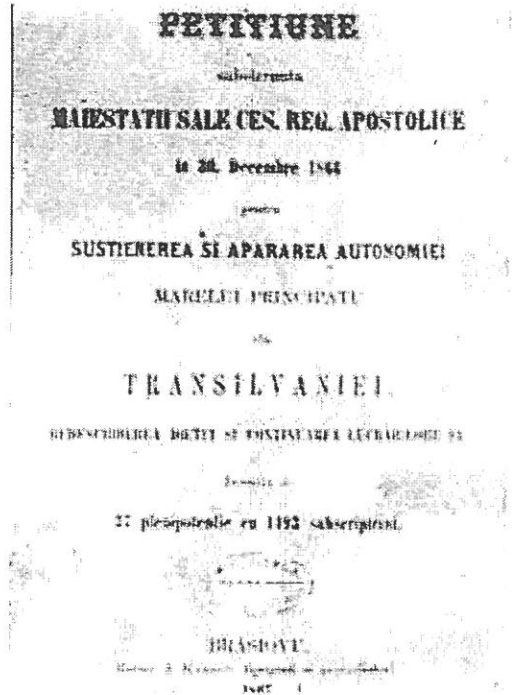
Foia de titlu a petiției lui G. Barițiu și Ioan Rațiu din 1866.