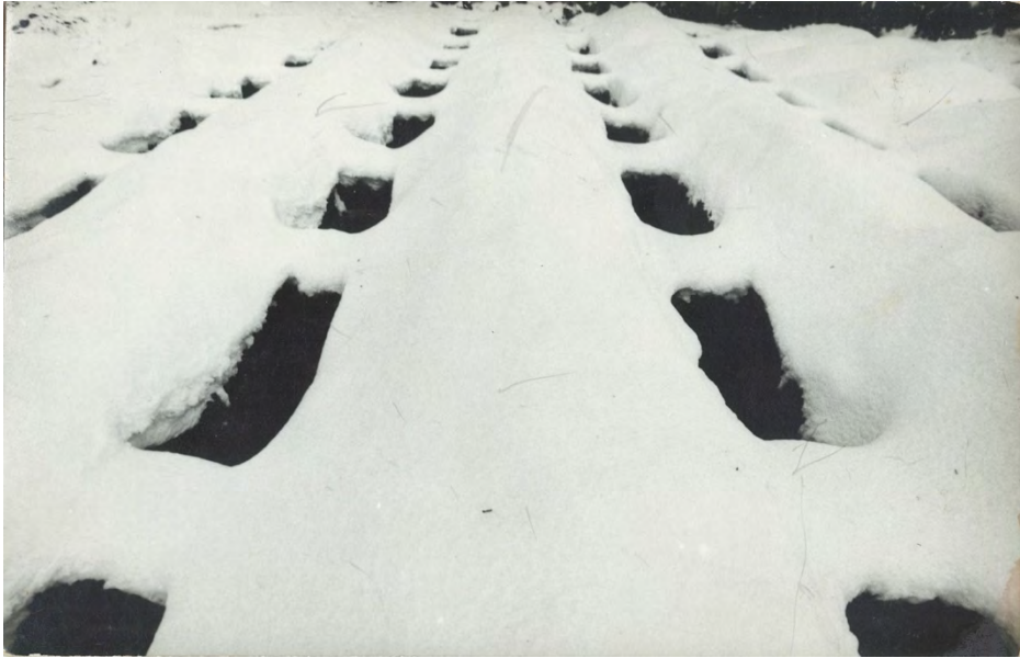
4 ianuarie 1990, București, unul din cimitirele unde se înmormântau morții Revoluției