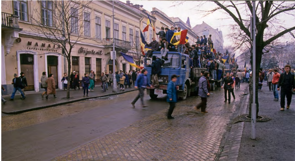
22 decembrie 1989, fostul Bulevard Petru Groza (în prezent Bulevardul Eroilor)