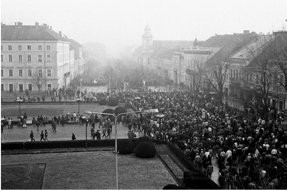
22 decembrie 1989, Piața Libertății (în prezent Piața Unirii)