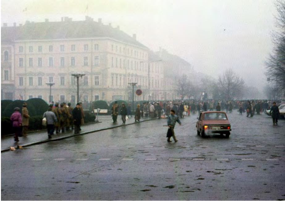
Decembrie 1989, Piața Unirii (fosta Piața Libertății)