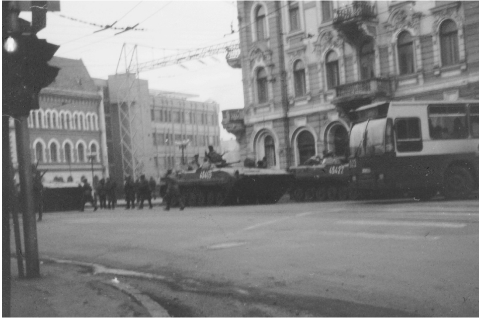
21 decembrie, zona Podul Horea