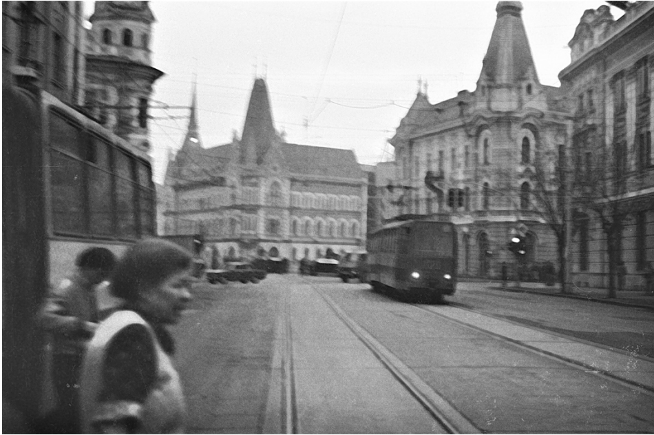
21 decembrie 1989, Strada Horea din Cluj-Napoca