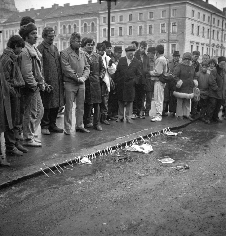
22 decembrie 1989, Piața Libertății (în prezent Piața Unirii)