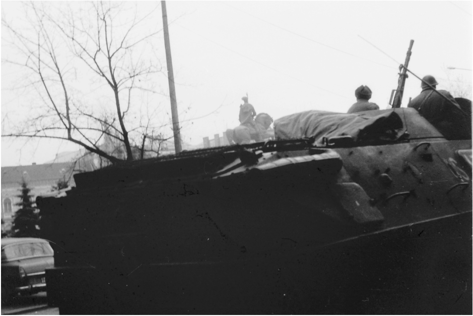
21 decembrie 1989, Piata Mihai Viteazul