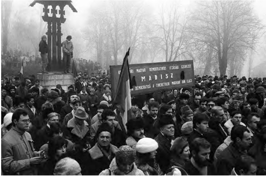
26 decembrie 1989, Cimitirul Eroilor din Cluj-Napoca