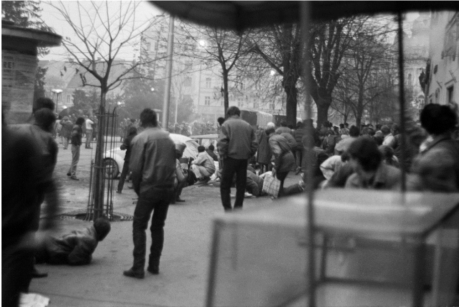
21 decembrie 1989, Piața Libertății (în prezent Piața Unirii)