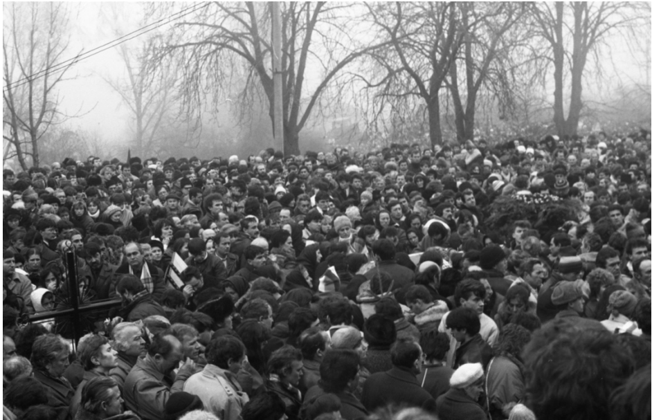
26 decembrie 1989, Cimitirul Eroilor din Cluj-Napoca