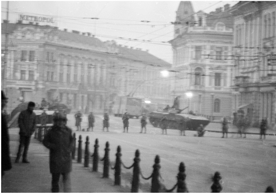
21 decembrie 1989, Podul Horea, zona fostului Hotel Astoria (în prezent, sediul Camerei de Comerț și Industrie Cluj)