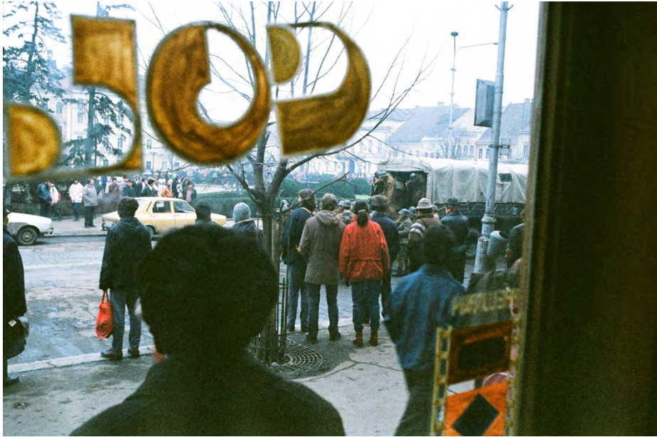
21 decembrie 1989, Piața Libertății (în prezent Piața Unirii)