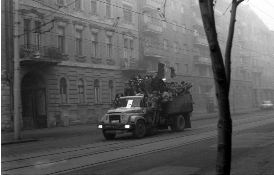
22 decembrie 1989, Strada Horea din Cluj-Napoca