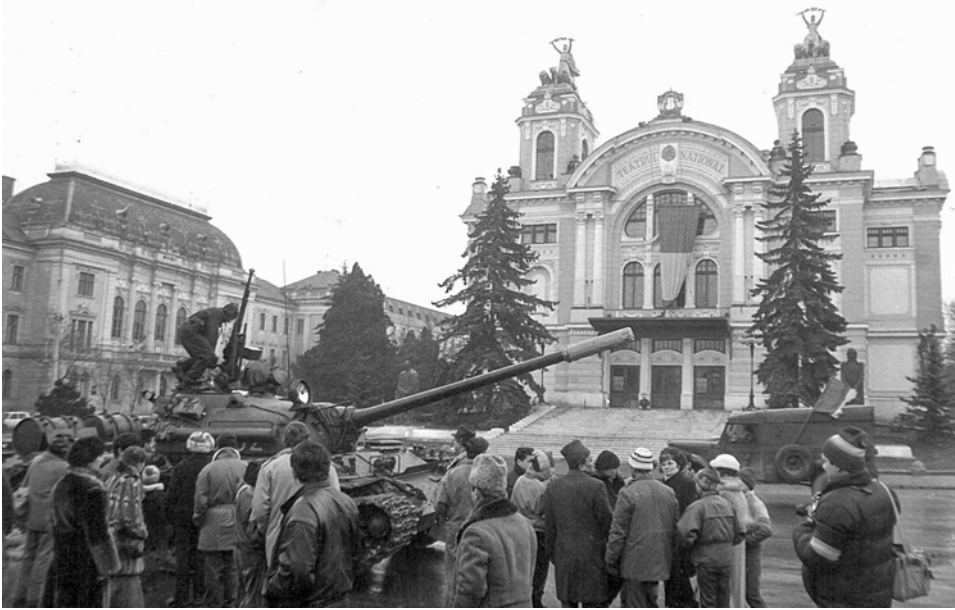
Decembrie 1989, Teatrul Național, Cluj-Napoca