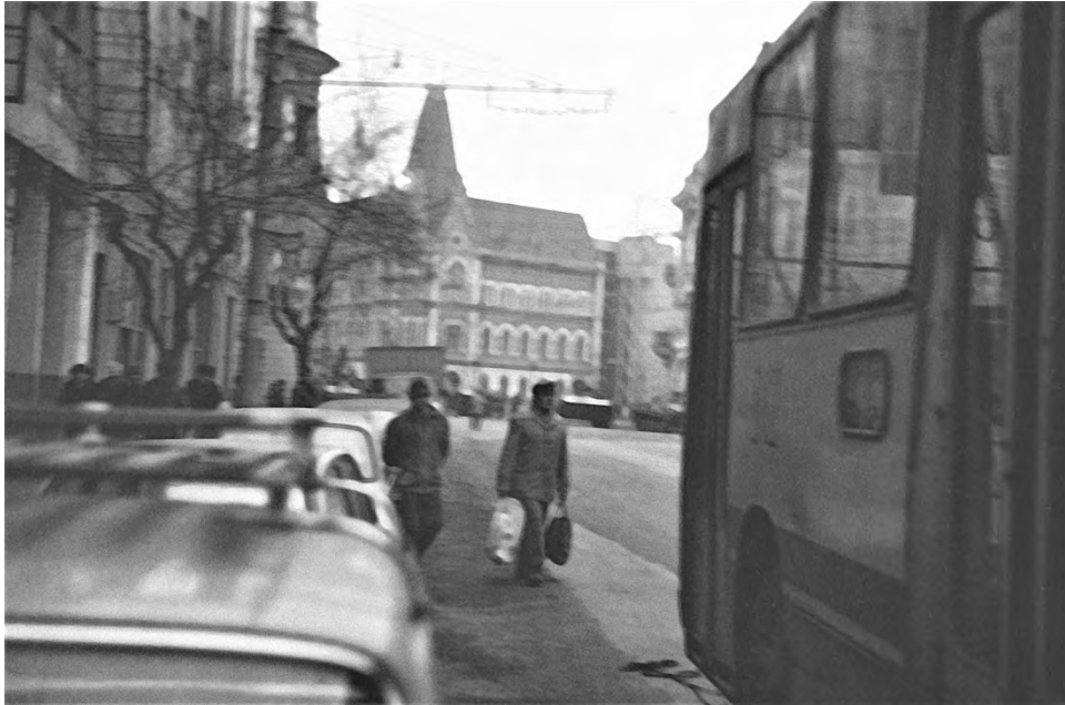
21 decembrie 1989, Strada Horea din Cluj-Napoca