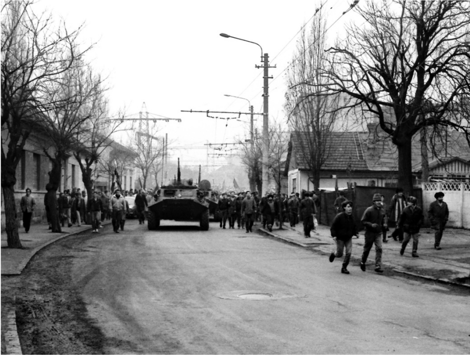
22 decembrie 1989, Strada Traian