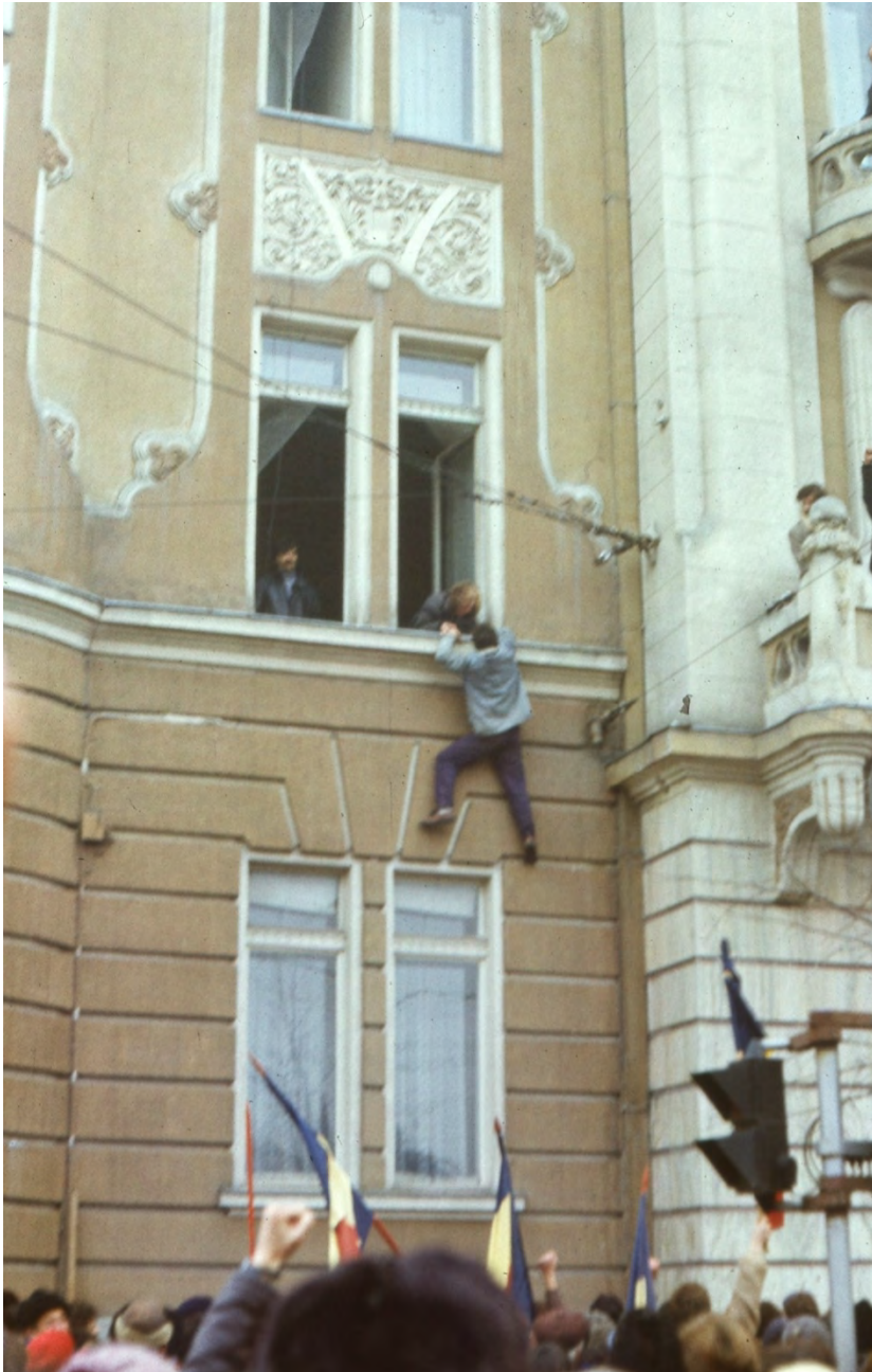
22 decembrie 1989, Revoluționar escaladând clădirea Comitetului Județean de Partid