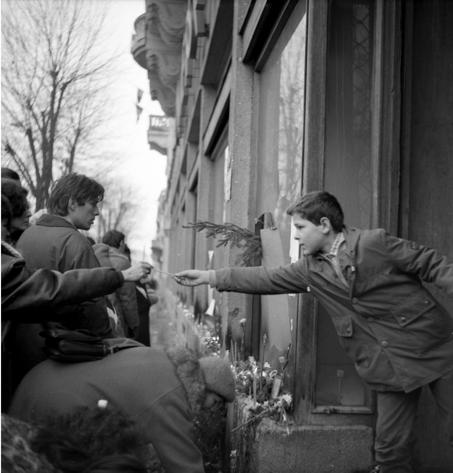
Decembrie 1989, Cluj-Napoca, Librăria Universității