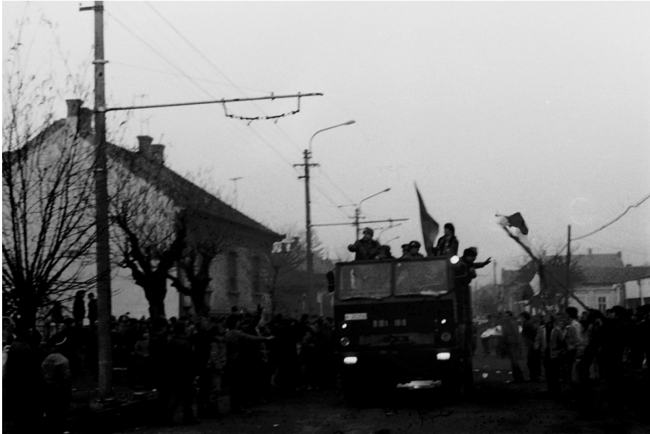
22 decembrie 1989, Strada Traian, Cluj-Napoca, în fața fostului sediul al Securității