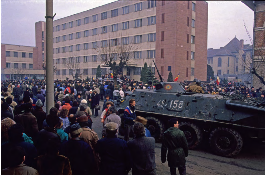
22 decembrie 1989, sediul Miliției de pe strada Karl Marx (în prezent strada Decebal)