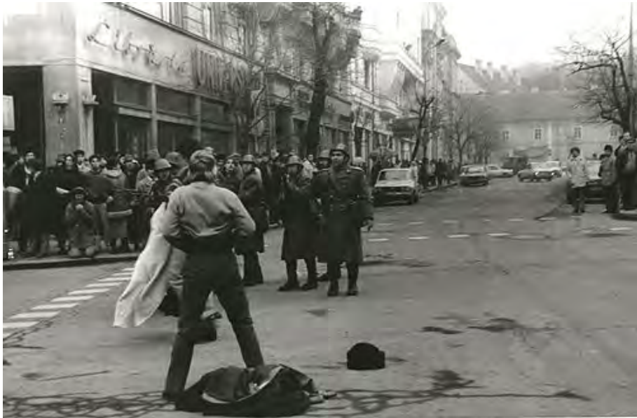
21 decembrie 1989, Piața Libertății (în prezent Piața Unirii), în jurul orei 15:45