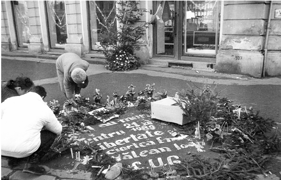
Decembrie 1989, zona Podul Horea