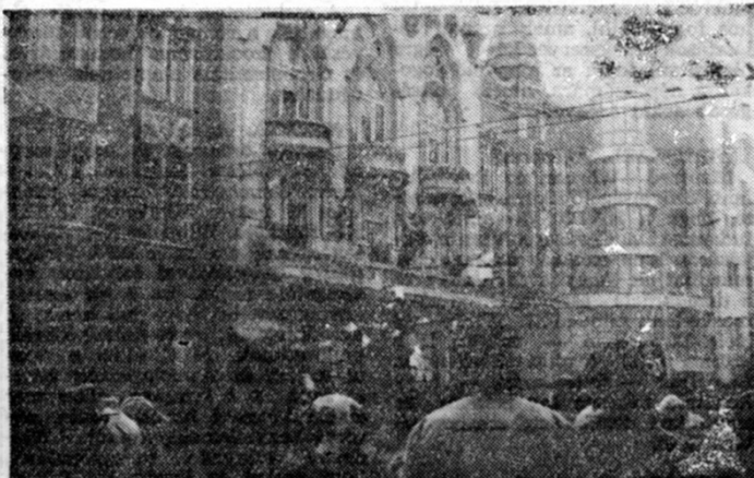
Tüntetők a megyei pártbizottság épülete előtt