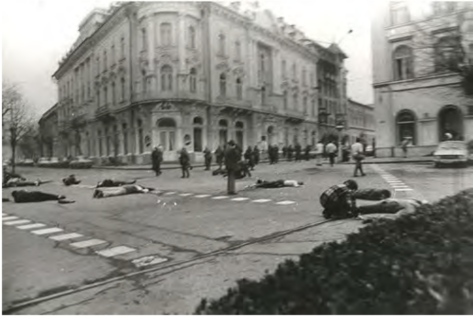
21 decembrie 1989, Piața Libertății (în prezent Piața Unirii), în jurul orei 15:55