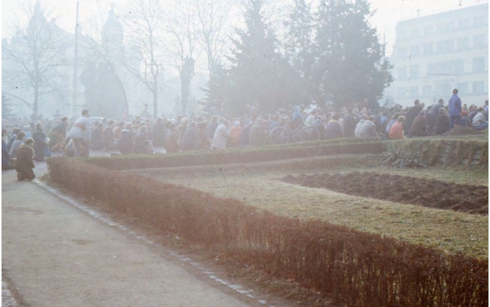
22 decembrie 1989, rugăciune la Catedrala Ortodoxă din Piața Victoriei (în prezent Piața Avram Iancu)