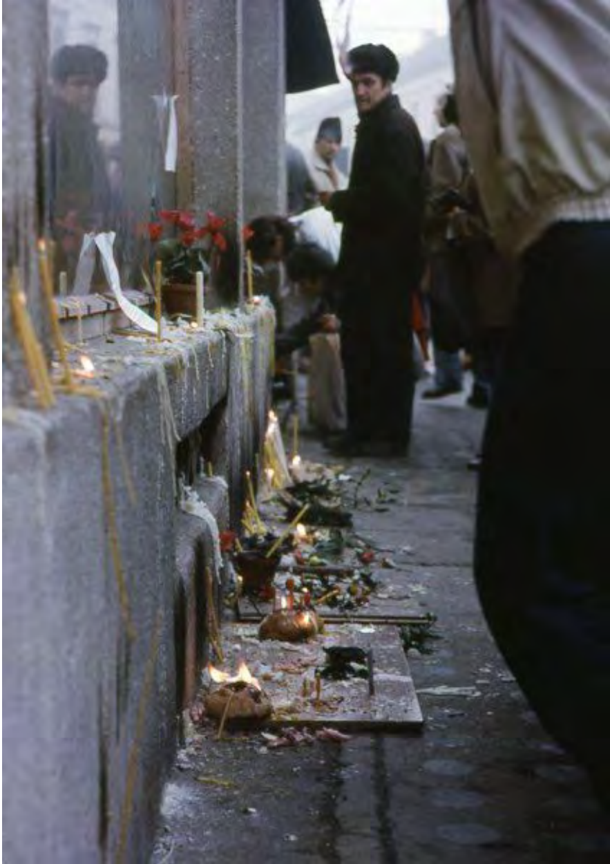
Decembrie 1989, lumânări la Librăria Universității