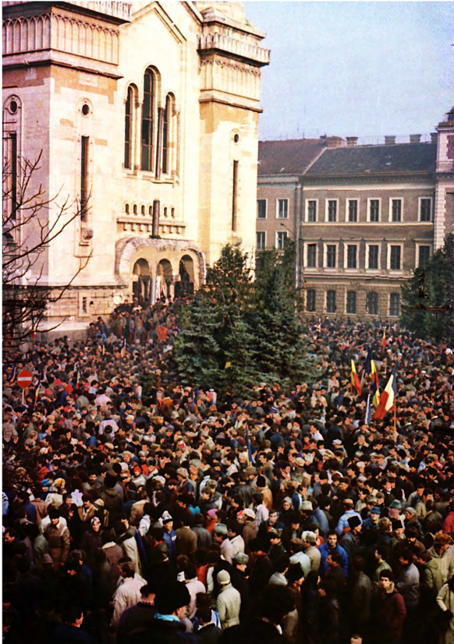
22 decembrie 1989, Catedrala Ortodoxă, Piața Victoriei (în prezent Piața Avram Iancu)