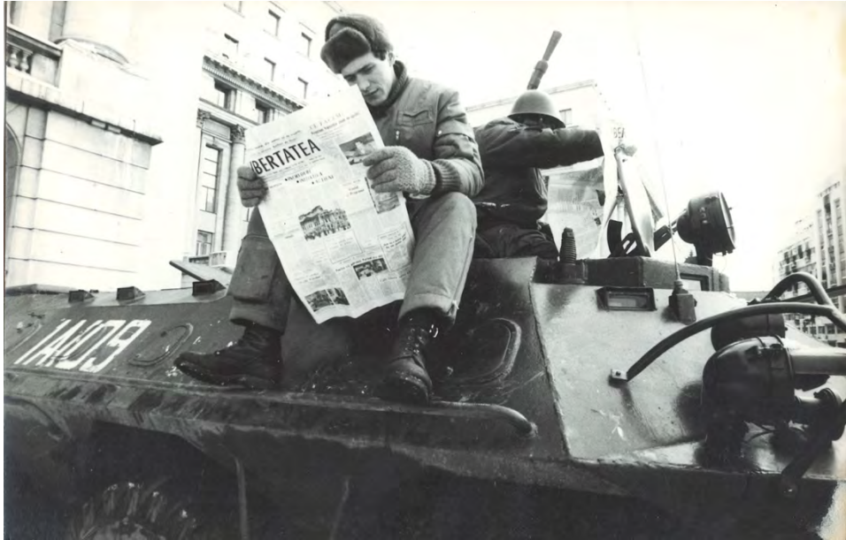
Ianuarie 1990, București, fostul sediu al Comitetului Central al Partidului Comunist Român