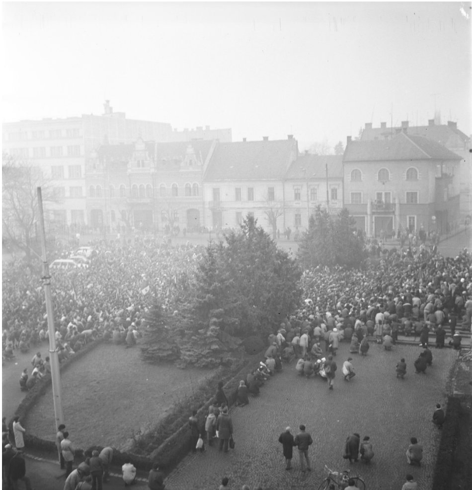
22 decembrie 1989, Piața Victoriei (în prezent Piață Avram Iancu)