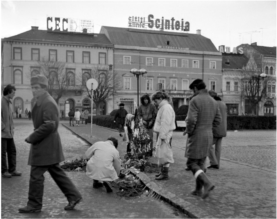
Decembrie 1989, Piața Libertății (în prezent Piața Unirii)