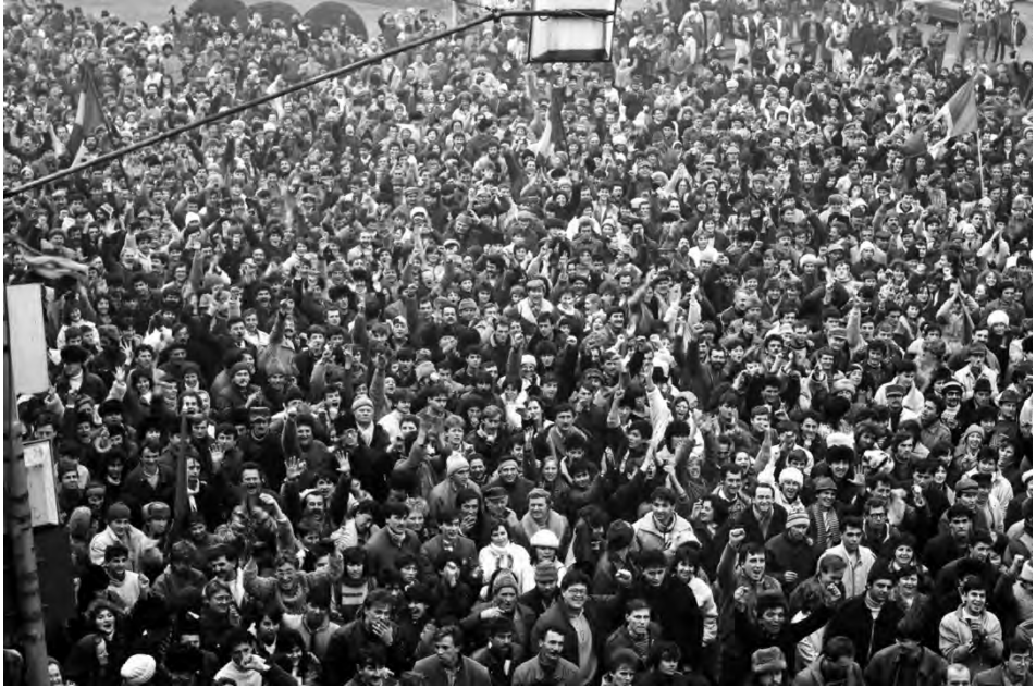
„Fața zilei de 22 decembrie”, din Balconul Primăriei, în prezent Bulevardul Eroilor