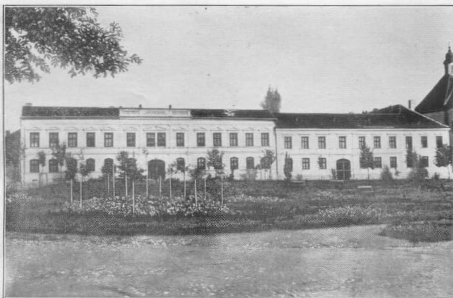
Academia de teologie, Seminarul teologic arhiepiscopesc și Ospiciul preoților.

„Ieșea din odăița Seminarului (asta va fi fost prin septembrie 1866) în piață... acolo se aflau precupețe care vindeau struguri; Eminescu de obicei cumpăra struguri, îi punea în pălărie, apoi, ținând pălăria în mâna dreaptă, pășea încet prin piața Blajului mâncând struguri [...]. Cu câteva zile înainte de septembrie Eminescu venise la Blaj. Fiind el lipsit și neavând cvartir, superiorii Seminarului Teologic i-au conces să locuiască în odaia amintită (a credințelor). În odaia aceasta a locuit Eminescu cu noi, vreo trei săptămâni”.