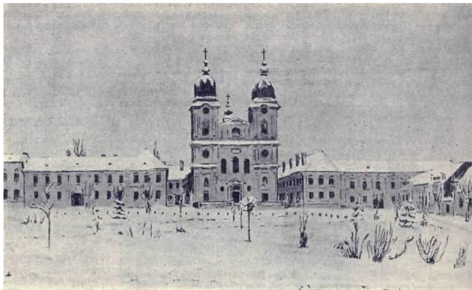
Catedrala Mitropoliei Române Unite cu Academia Teologică, în dreapta, și liceul de băieți din Blaj, în stînga (După o acuarelă a d-lui Prof. Marian)

Am sosit la Alba Iulia pe ziua de 29 noiembrie [...]. Ziua de 1 decembrie era o zi rece de iarnă. Bătea un vînt care te pătrundea prin oase [...]. Nu se poate descrie tabloul evenimentului. Oamenii plîngeau de emoție și bucurie. Se îmbrățișau unii cu alții. Se cîntau cîntece patriotice. Se dansa Hora Mare [...]. În acest sentiment al dragostei de patrie, în desăvârșirea unității naționale, găseam putere și noi, tinerii, pentru a începe să trăim din nou viața școlii și școala vieții care îl formează pe om pentru destinul său social.