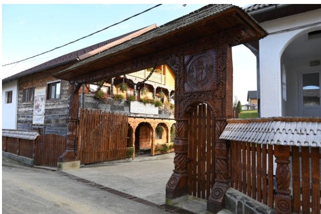
Poartă maramureșeană, 2016