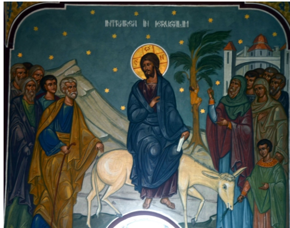
Intrarea în Ierusalim