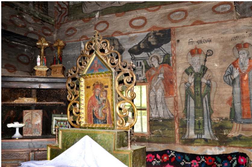
Icoană de altar, Maica Domnului cu Pruncul Iisus Hristos