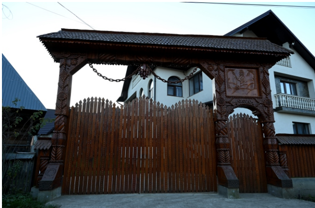
Poartă maramureșeană, 2020