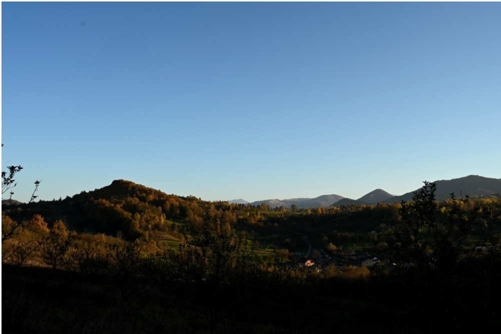
Măgură (Măgura Glodului)