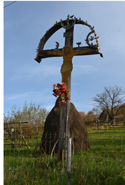
Troițe realizate în perioada 1980-1985