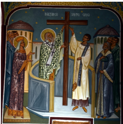
Înălțarea Sfintei Cruci