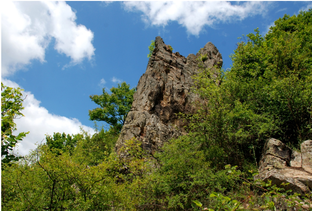
Stânca „Biserica Dacilor” (Stânca „Biserica Dracilor”)