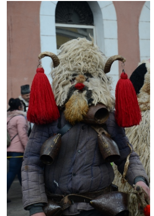
„ViŃlaimul”, piesă de teatru popular