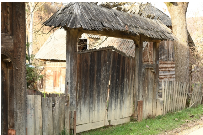
Poartă maramureșeană, 1970