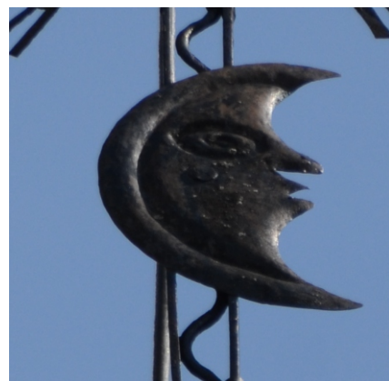
Crucea din vârful turnului cu luna antropomorfizată