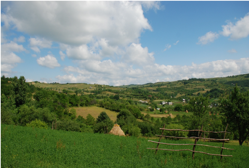
Obcină Vârful Runcu