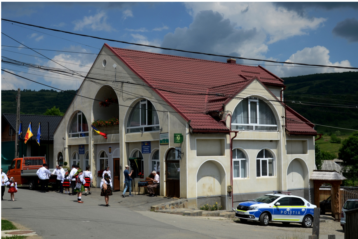
Primăria Poienile Izei