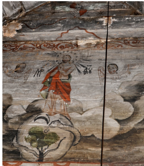
Înălțarea Maicii Domnului