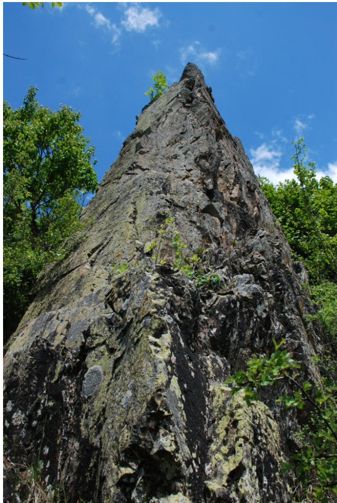
Stâncă „Biserica Dacilor” (Stâncă „Biserica Dracilor”)