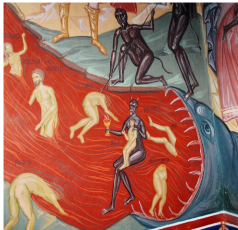
Capul de reptilă a monstrului Leviathan