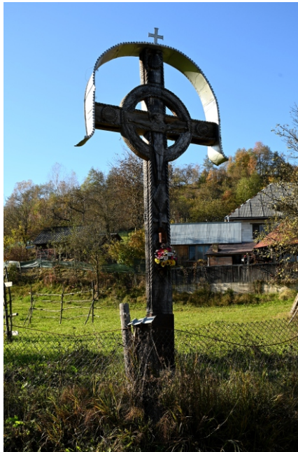
Troiță 17-VII 1998