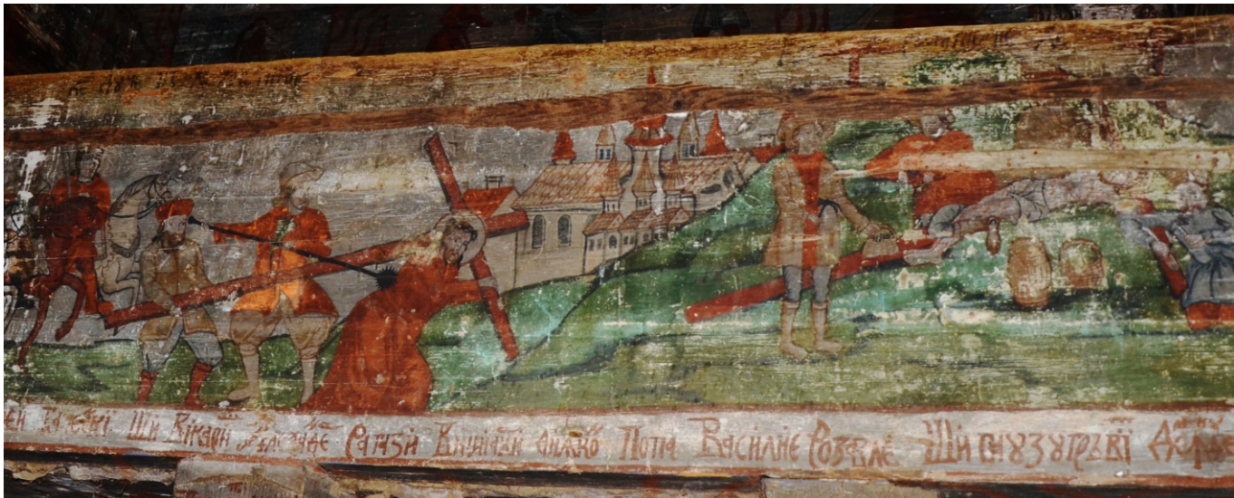
Pictura de pe balcon