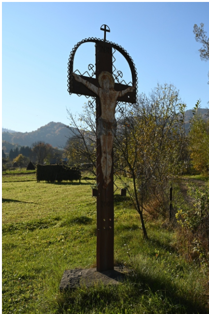
Troiță din fier 2007