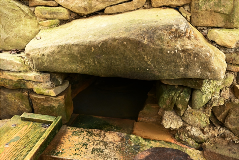
Borcutul de pe Valea Luntroasă

Borcutul este folosit intens de localnici pentru afecțiuni gastrointestinale, hepatobiliare și ca apă de masă.