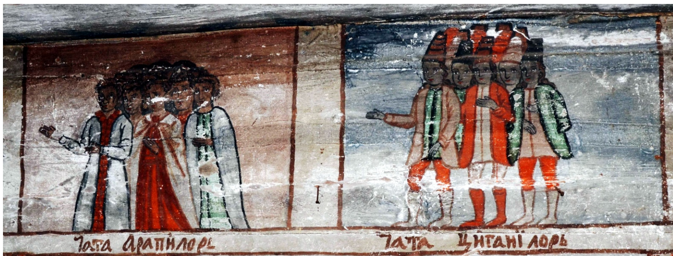
Ceata arapilor/harapilor (arabi)