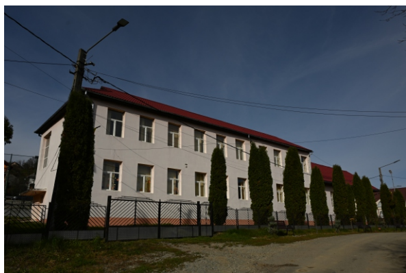
Școala Teren de fotbal