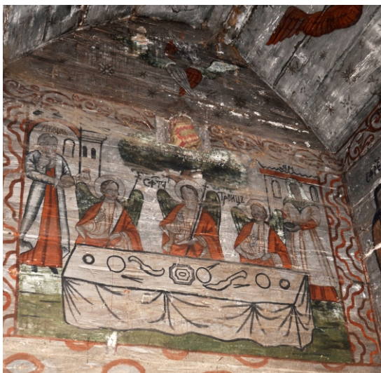
Serafim Sfânta Treime la Mamvri