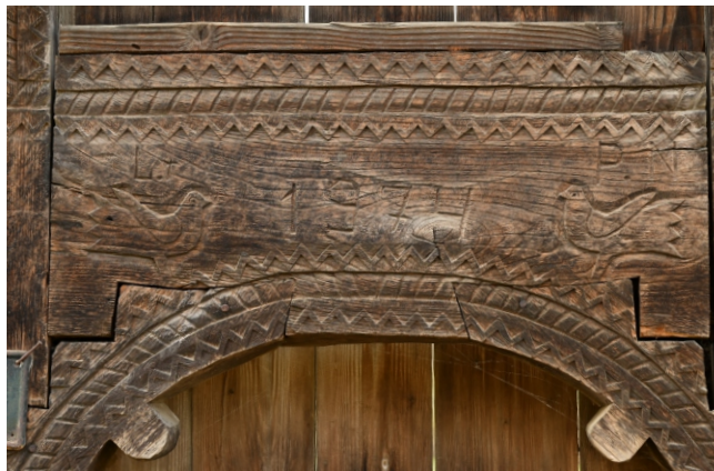
Detaliu poartă maramureșeană, 1974