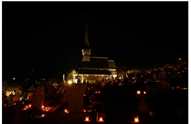
Luminație (Ziua Morților)