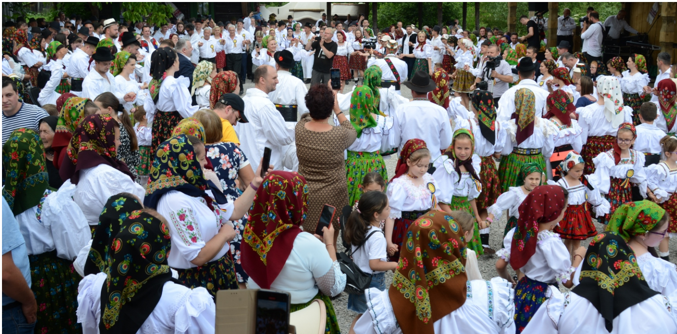
Jocul satului „Horea Poienarilor”