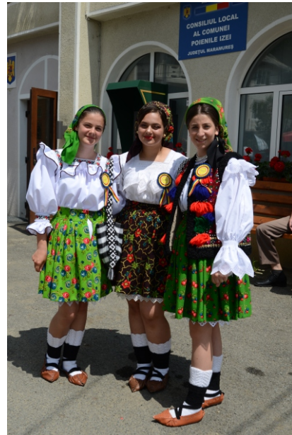
Jocul satului „Horea Poienarilor”