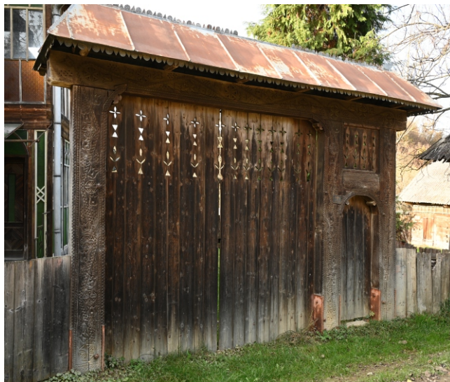
Poartă maramureșeană, 1974