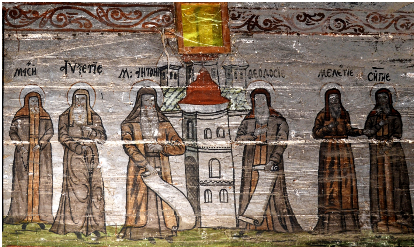
Cuviosul Moise Cuviosul Avxentie Sfântul Cuvios Anton (Antonie de Kiev, fondator al tradiției monahale din Rusia Kieveană) Sfântul Cuvios Teodosie (Antonie de Kiev împreună cu Teodosie de la Kiev au întemeiat în secolul al XI-lea, complexul mănăstiresc Lavra Pecersha (Lavra Peșterilor) Cuviosul Meletie Cuviosul Serghei

Sfinții Cuvioși de la Lavra Pecersha din Kiev, Ucraina (37, p. 137)