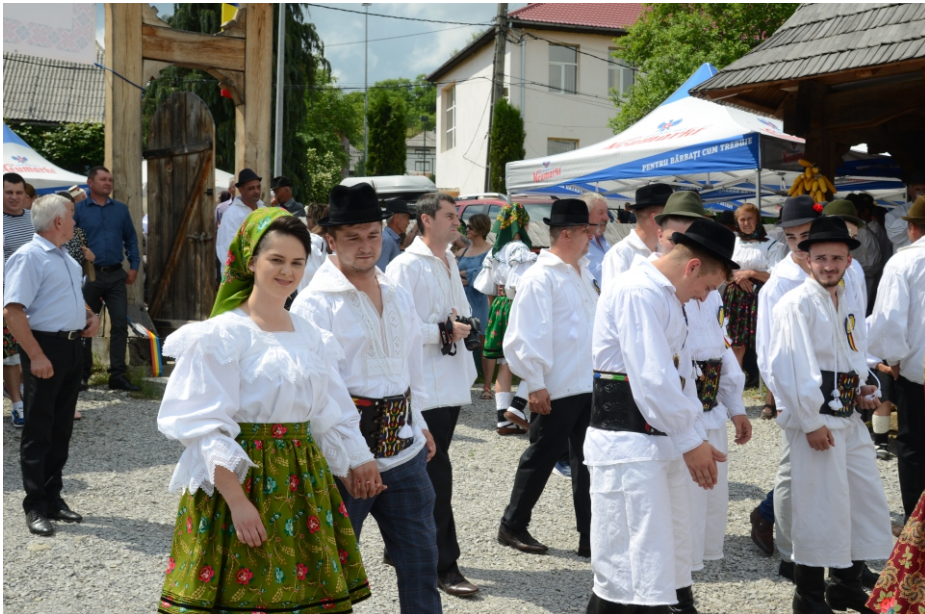
Port de vară