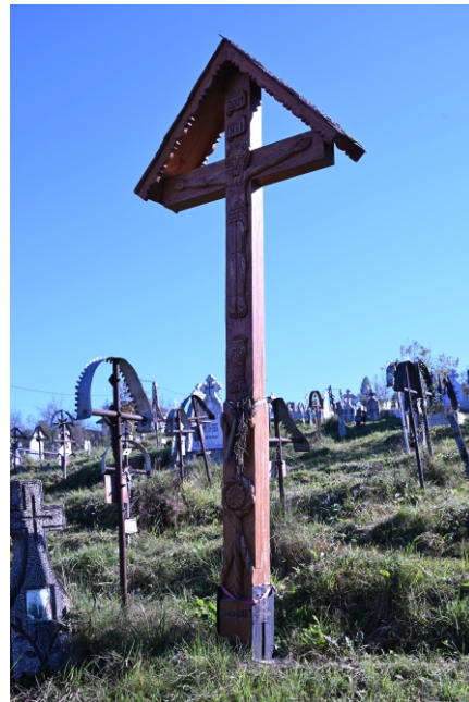
Troiță 2021 Bârsan ART