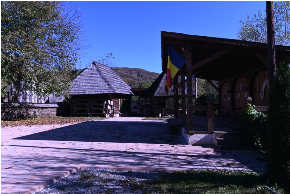
Locul unde se organizează „Jocul Satului”

Loc de popas și punct de belvedere asupra localității Poienile Izei, amplasat lângă drumul județean DJ 171 D Poienile Izei - Glod - Slătioara