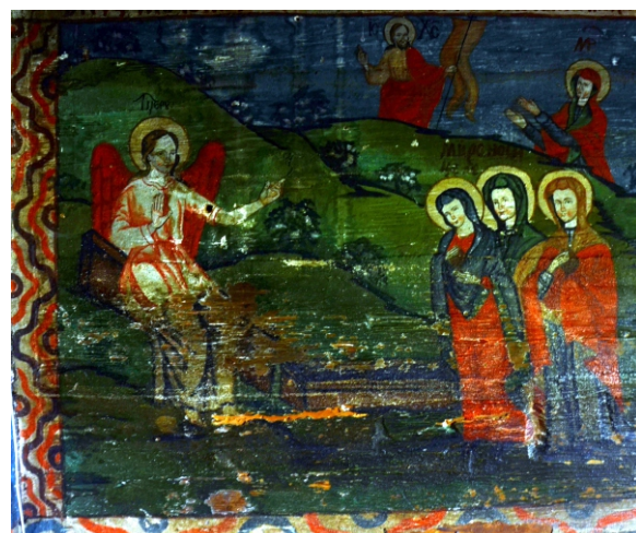
Învierea lui Iisus