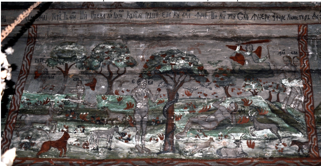
Facerea lui Adam și Eva