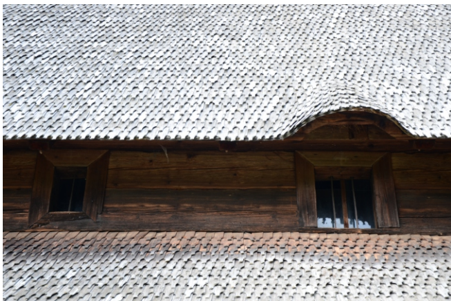
Acoperiș cu poală dublă (etajat)