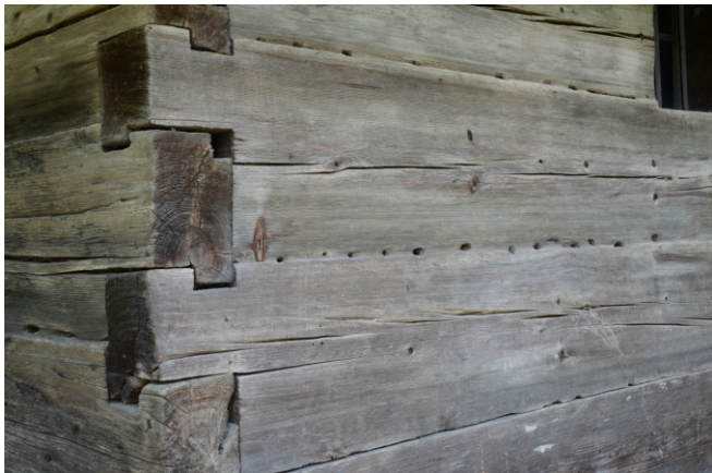
Îmbinarea la colțuri este în „cheotoare în dinte”