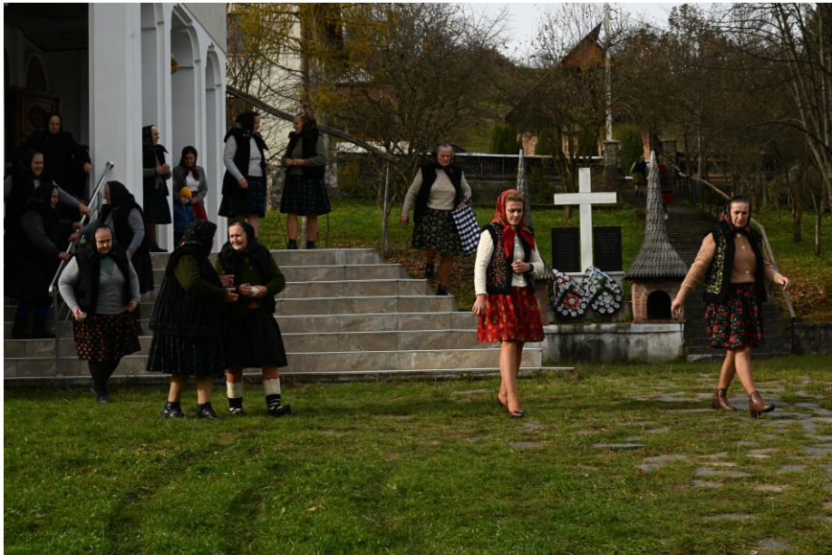
Femei, fete Pânzătură Sfeter Sumnă