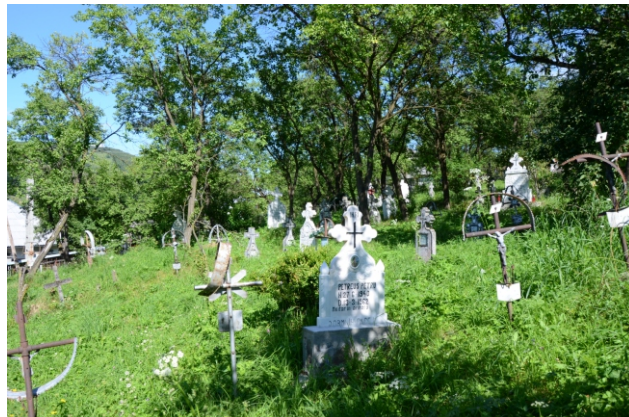
Cimitirul din localitatea