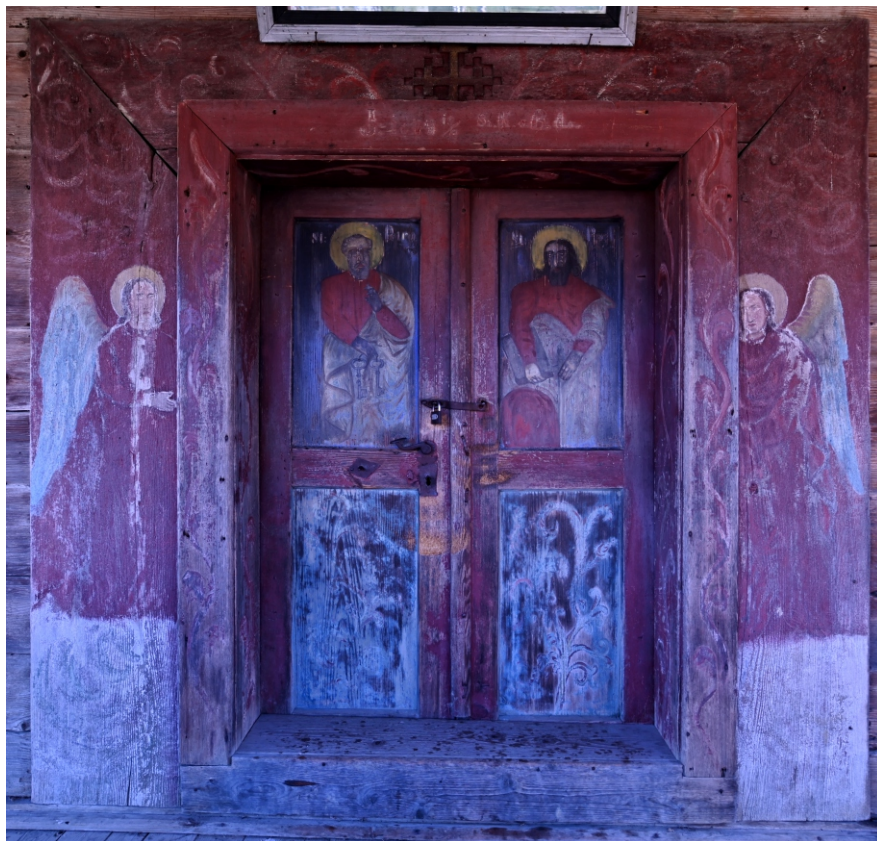
Portalul și ușa de la intrare