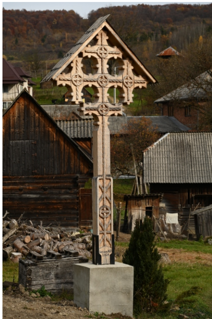
Troiță. Bârsan ART 2021