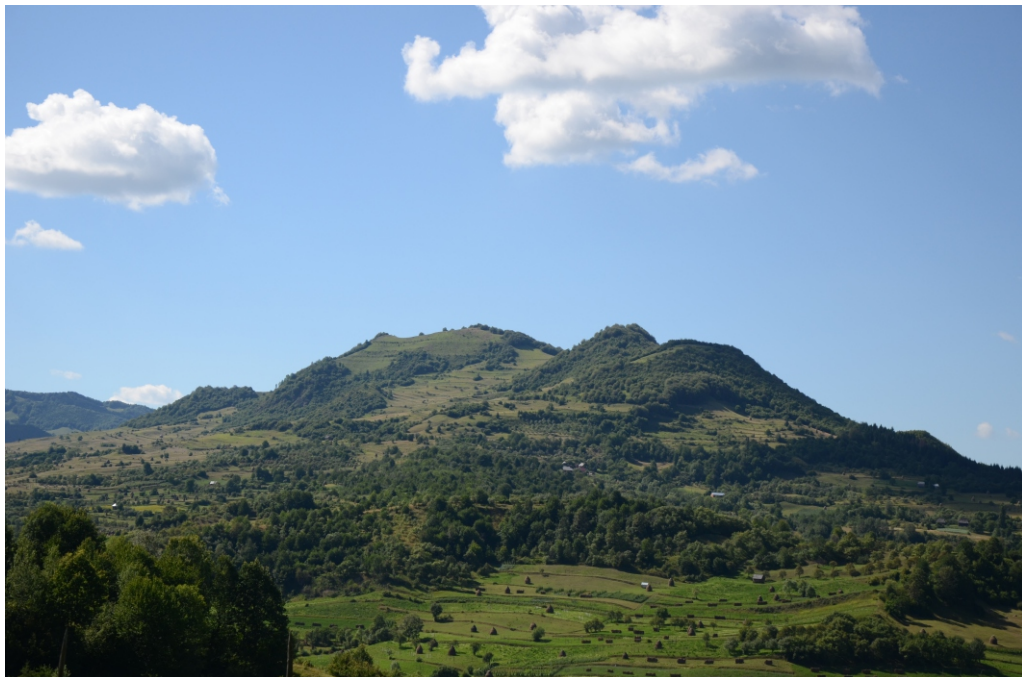
Vârful Măgura - 972 m (Vârful Măgura Glodului)