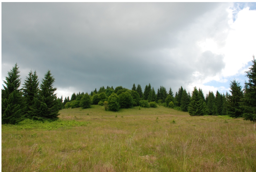
Vârful Scărișoara - 1226 m