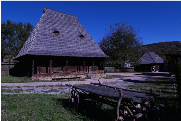
Muzeul sătesc „Casa Țărănească” secolul al XVIII - lea