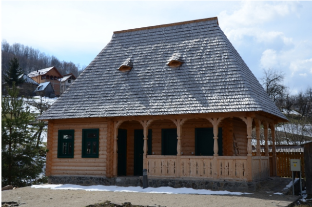
Punct de informare turistică