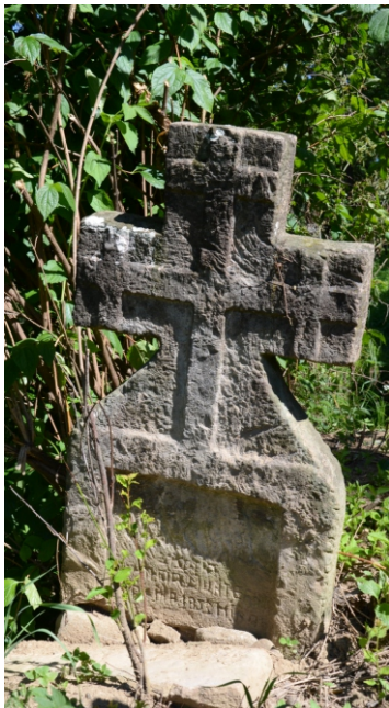
Cruci din piatră