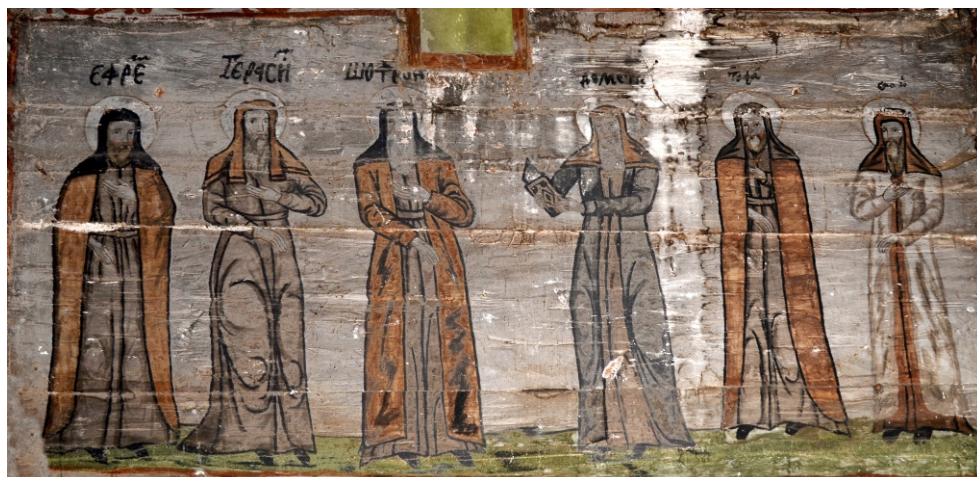
Pictură din altar

Sfinții Cuvioși de la Lavra Pecersha din Kiev, Ucraina (37, p. 137)