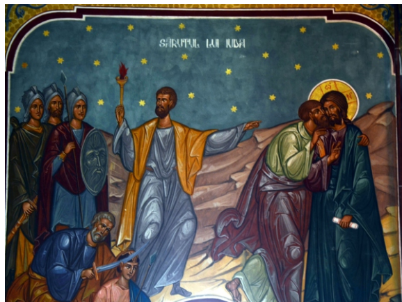
Sărutul lui Iuda

Picturi din biserică realizate de pictorul Ioan Botiș