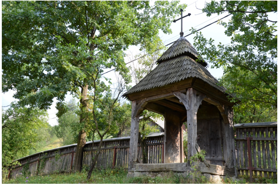
Porți la intrare în cimitir