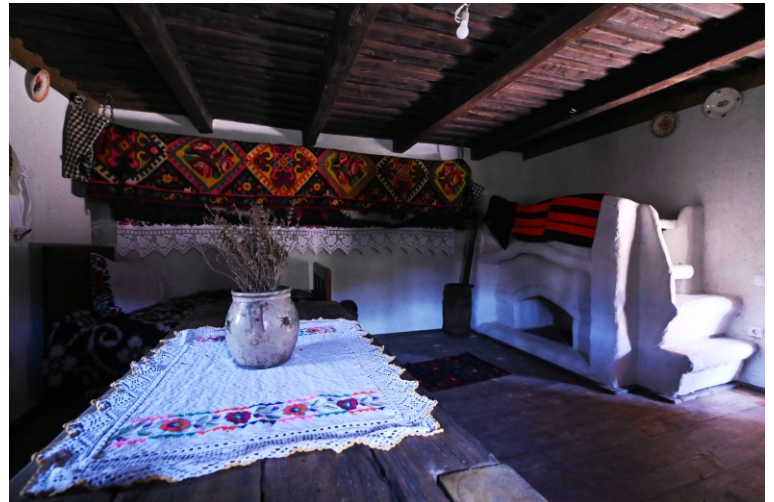
Muzeul sătesc „ Casa Țărănească ” secolul al XVIII - lea