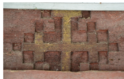
Crucea multiplicată de pe portal