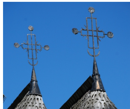
Cruci pe acoperișul bisericii