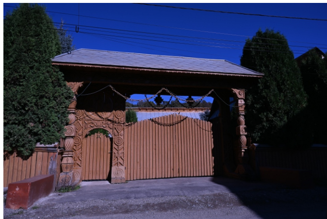
Poartă maramureșeană, 1996