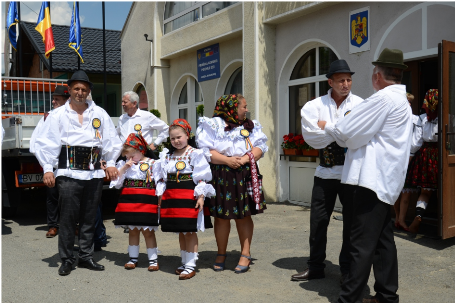
Port de vară