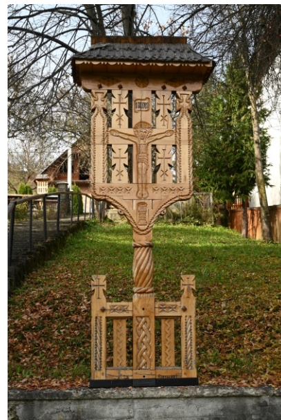
Troiță ANUL 2021 Bârsan ART

Troițe din localitate și inscripțiile de pe ele