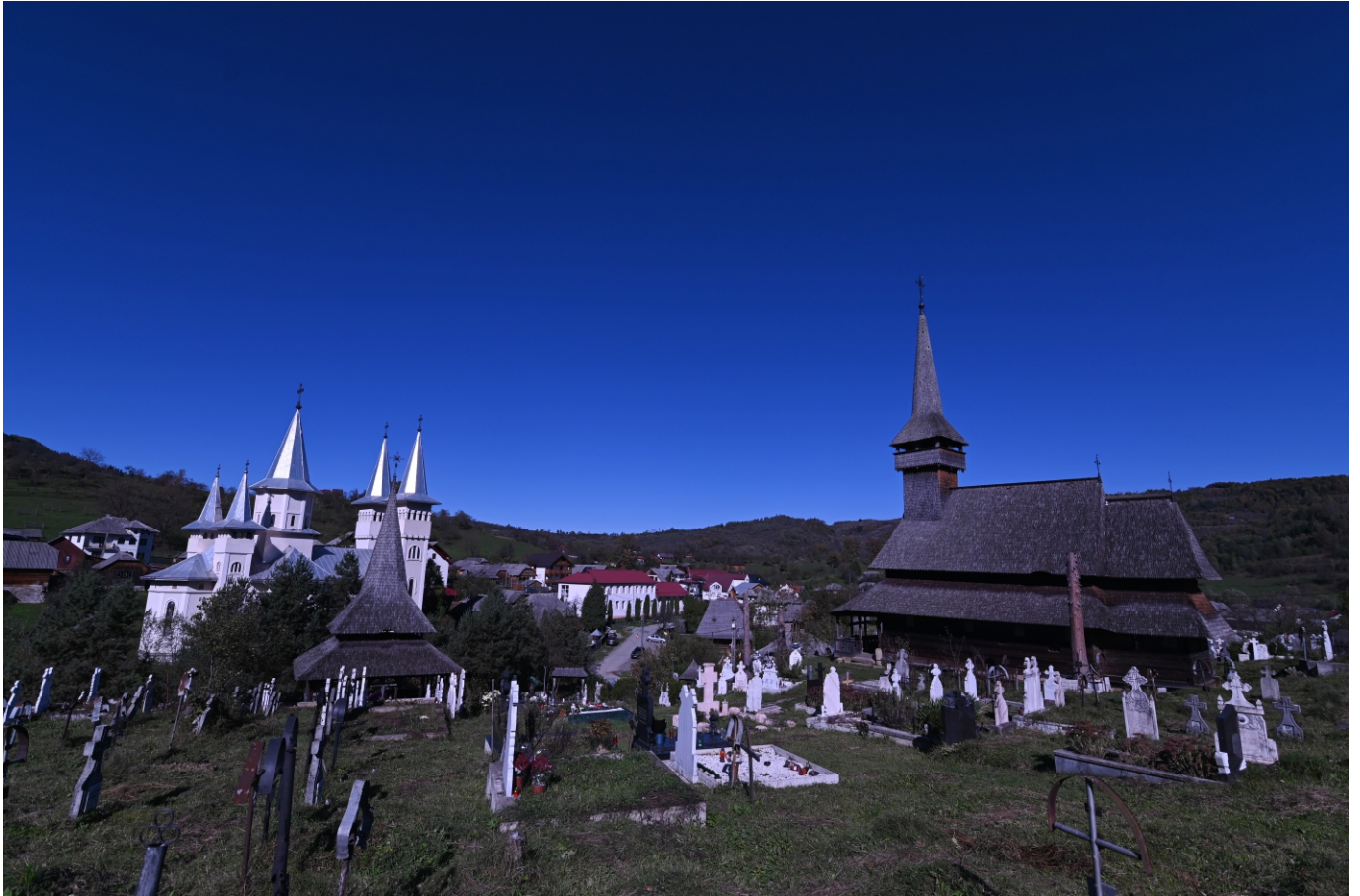
Biserica „ Sfântul Mare Mucenic Gheorghe ” Altarul de vară Cimitirul Biserica de lemn „ Sfânta Cuvioasa Parascheva ”