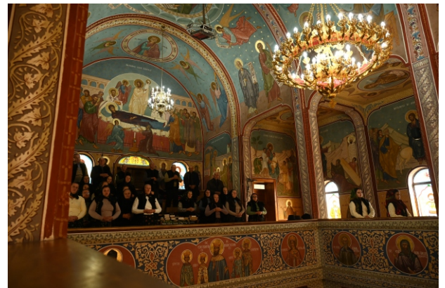
Biserica „ Sfântul Mare Mucenic Gheorghe ” Biserica a fost edificată în perioada 1987-2003 A fost sfințită în anul 2003