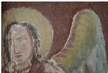
Picturi pe ușa bisericii