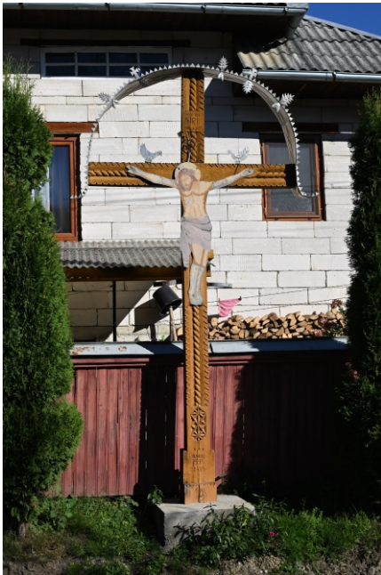
Troiță -1995- -21-04-