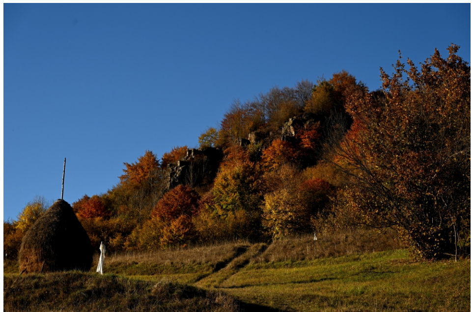
Stânci de pe Măgură