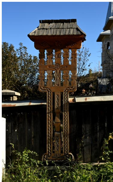
Troiță ANUL 2021 Bârsan ART

Troițe din localitate și inscripțiile de pe ele