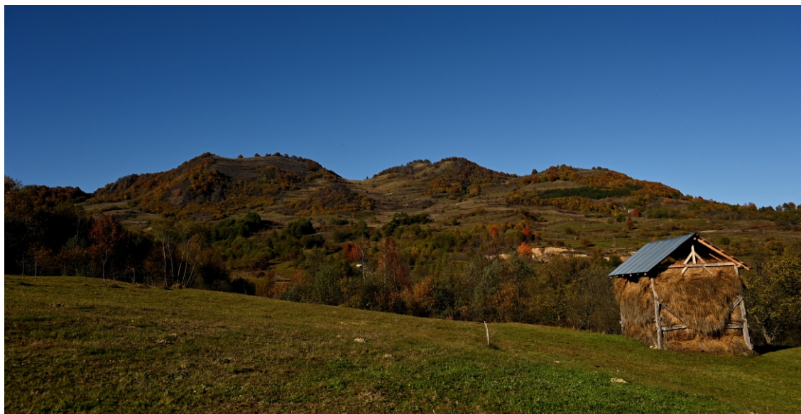
Măgură (Măgura Glodului)