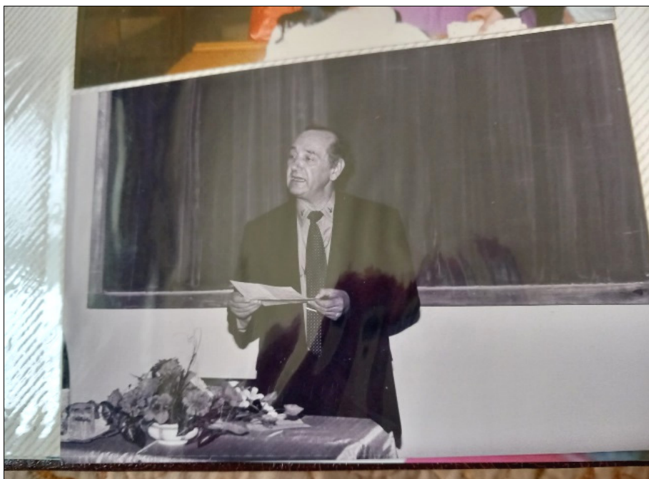
Concurs pentru ocuparea funcției de inspector școlar