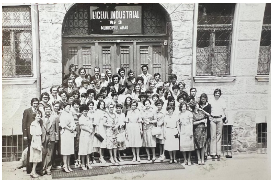
Sfârșit de liceu