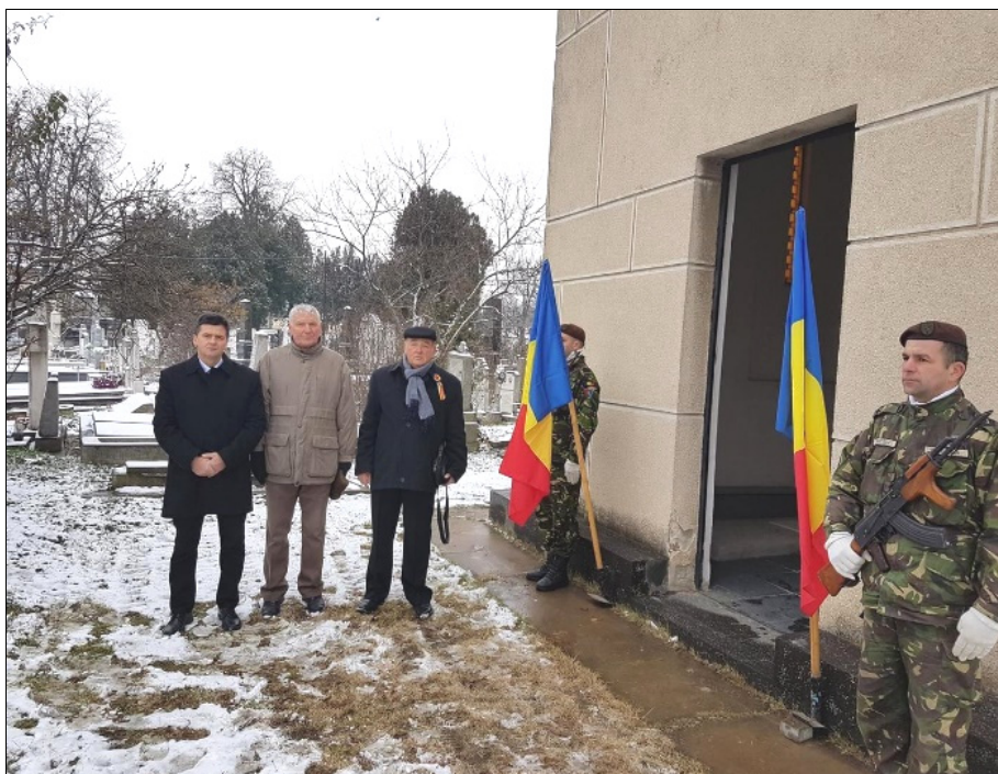
Depunere de coroane, mormântul lui Ștefan Cicio Pop, 1 decembrie 2018