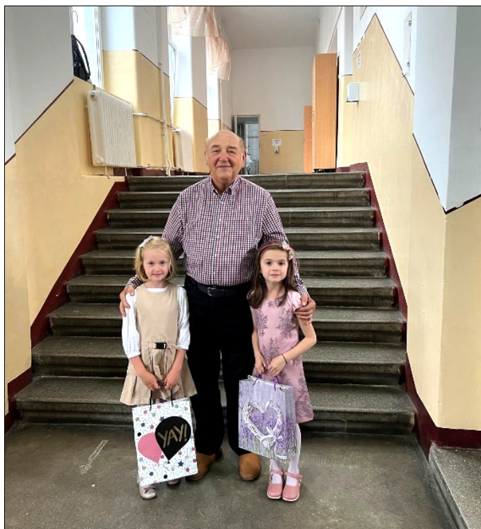
Sfârșit de clasa I, alături de nepoțele