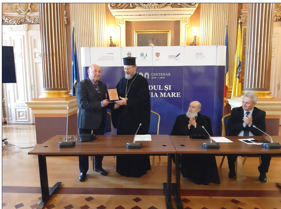
Primind Distincția de Excelență Aradul și Marea Unire