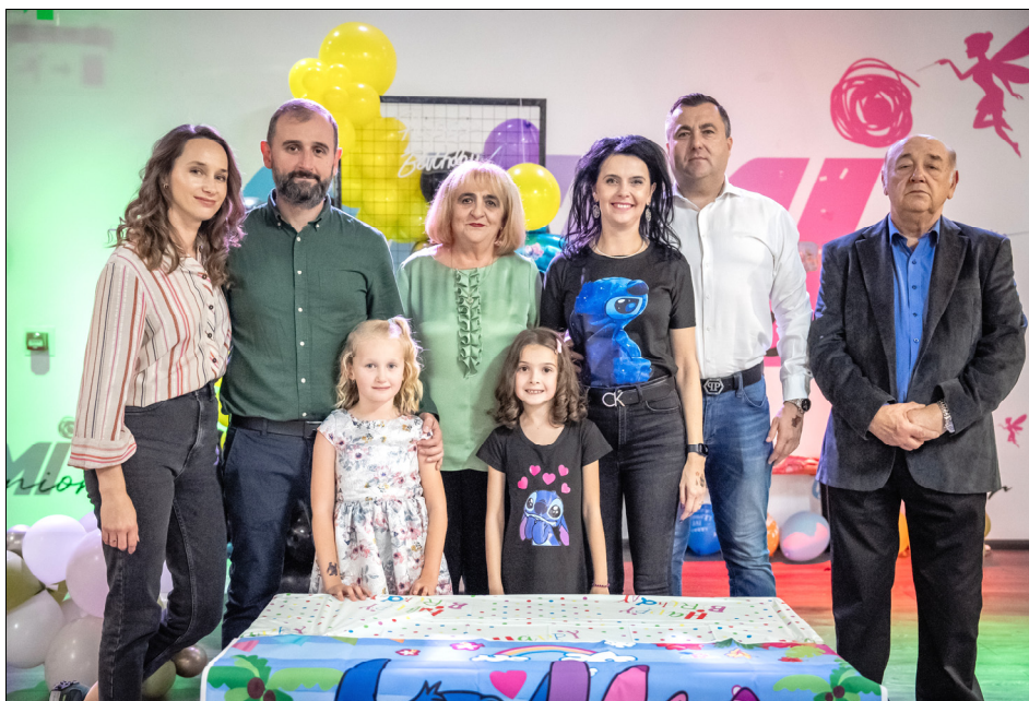
O amintire pentru o viață