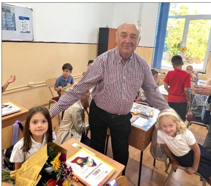
Bubu cu nepoțelele la început de clasa I