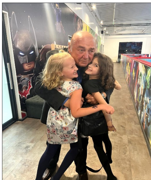
Bucuria unei surprize